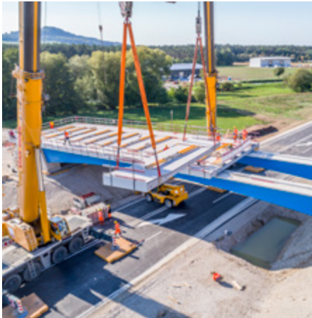
1. Preis: Pilotprojekt Segmentbrücke, Max Bögl, B299, Ortsumgehung Mühlhausen