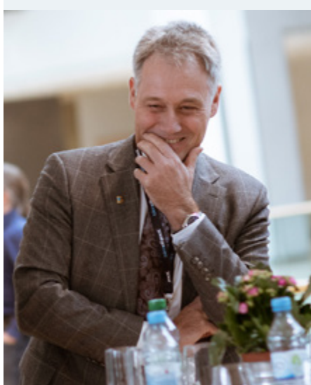
Wer für BIM gerüstet ist, hat gut lachen.

"In Zukunft werden Erdbaugeräte autonom ihre Arbeit verrichten und dabei von Daten gesteuert, die in der Planung generiert werden. Die Grenzen zwischen Planung und Ausführung werden weichen.