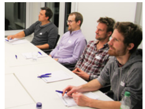
Junge Ingenieurgeologen lernen die Kammer kennen.

Etabliert hat sich auch das Forum Ingenieurgeologie, welches Ende November zum dritten Mal stattfand und großen Zuspruch fand. Dem Wunsch der Teilnehmer nach mehr interdisziplinären Exkursionen zu bedeutenden regionalen Bauprojekten wird der Arbeitskreis Geotechnik und Ingenieurgeologie bestmöglich nachkommen. Eine Fortsetzung des Forums ist bereits für den Herbst 2019 in Planung. Wir informieren Sie rechtzeitig.