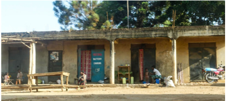
Das Gesundheitszentrum in Kako ist in ähnlich schlechtem Zustand wie das Gebäude oben.

Statistisch gesehen kommt in Uganda auf 21.700 Einwohner ein Arzt. In den ländlichen Regionen ist die Situation besonders schlecht. Das 7000-Einwoh-