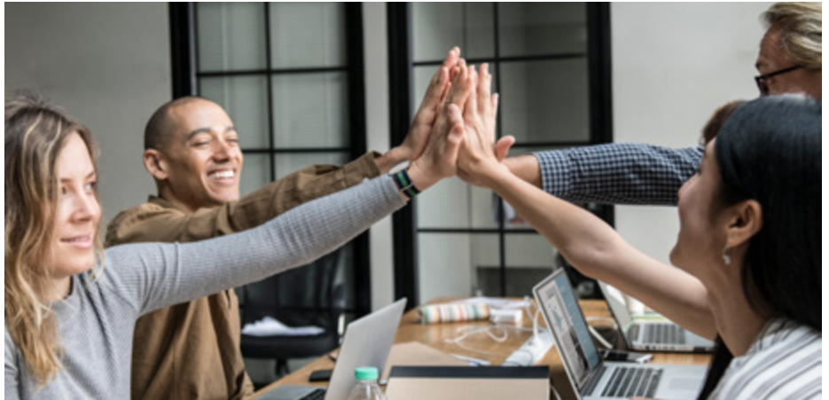
Zufriedene Mitarbeiter sind der Schlüssel zum Erfolg.