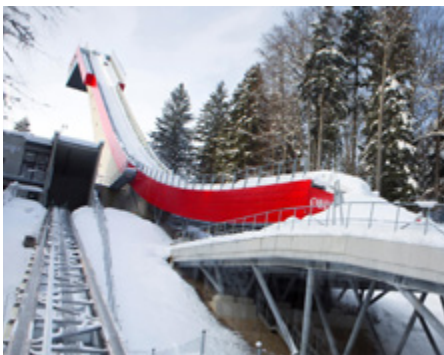
2. Preis: Heini-Klopfer-Skiflugschanze Oberstdorf, Konstruktionsgruppe Bauen, Kempten

Kennzeichnend ist die klare Trennung des Längstragwerksystems von längs- und quervorgespannten Fahrbahnplatten. Die auf luftdicht verschweißten Stahlhohlkastenträgern aufgelagerten, mittels externer Vorspannung im Gehwegbereich zusammengespannten Fahrbahnplatten können direkt befahren werden und sind problemlos austauschbar. Ergebnis ist eine wartungsarme Brückenkonstruktion, bei der die Vorteile serieller Werksvorfertigung von Bauteilen zum Tragen kommen."